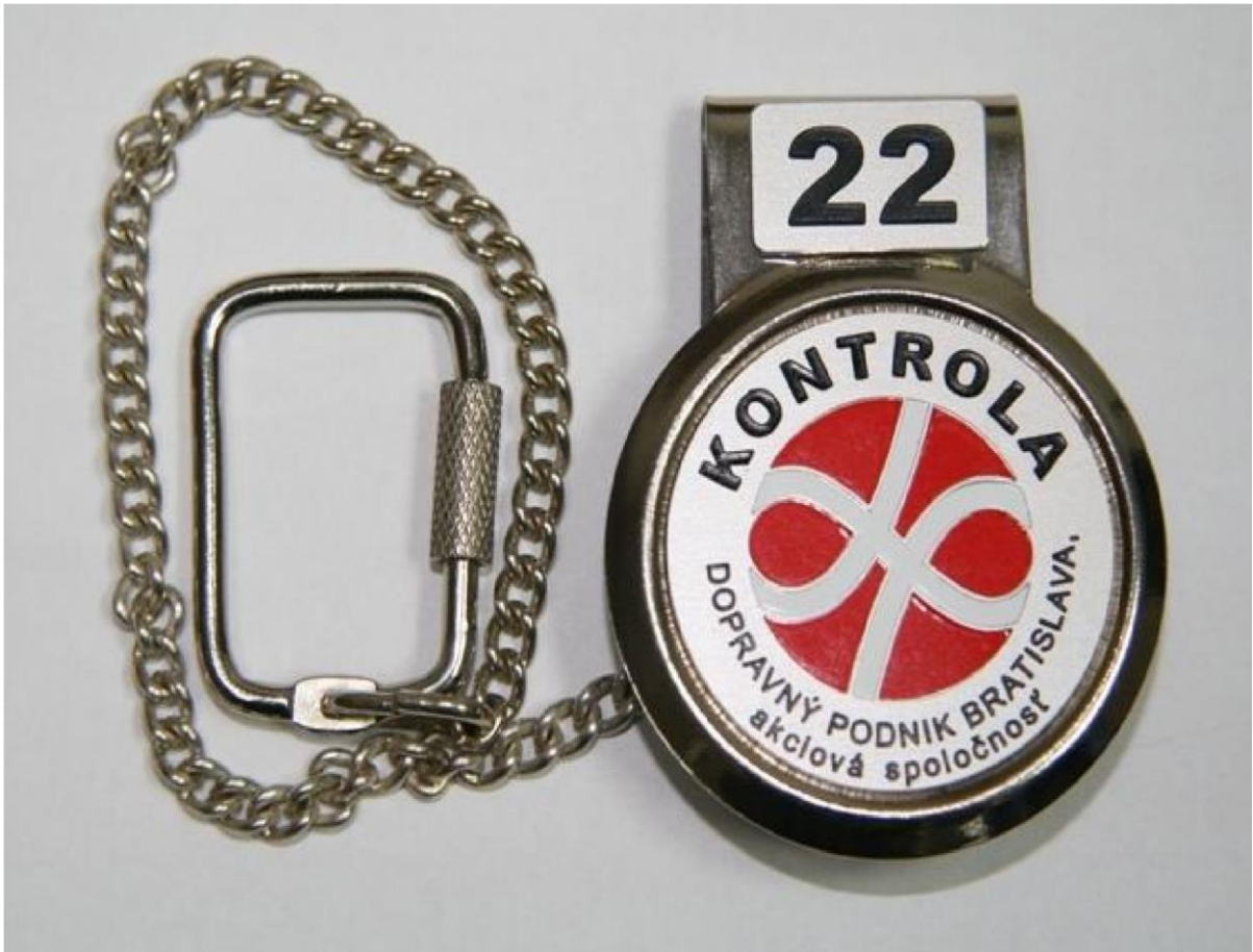
Príloha č. 1: