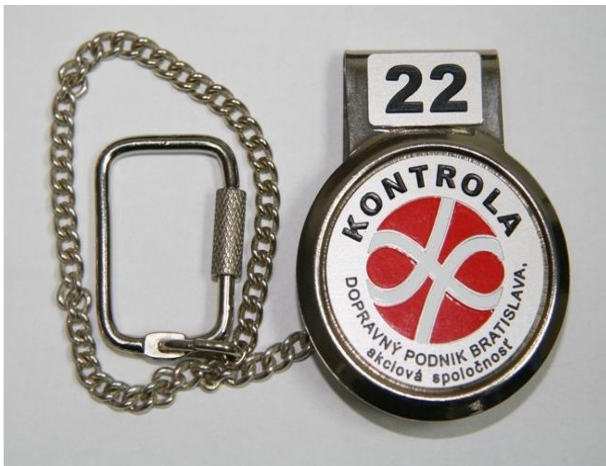
Príloha č. 1: