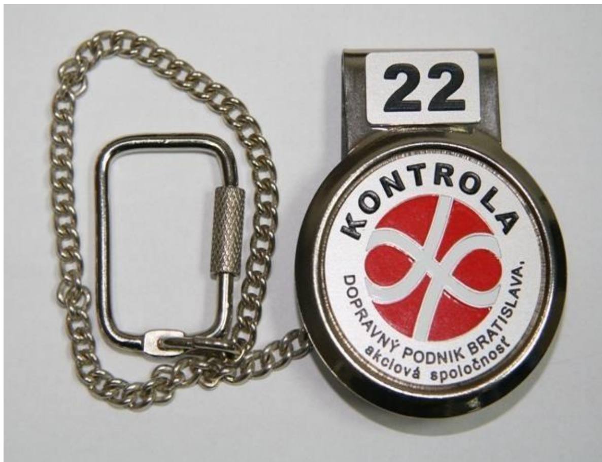
Príloha č. 1: Kontrolný odznak oprávnenej osoby dopravcu