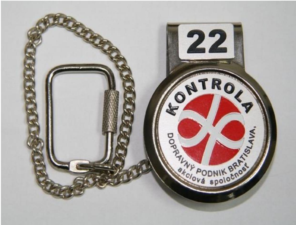
Príloha č. 1: Kontrolný odznak oprávnenej osoby dopravcu